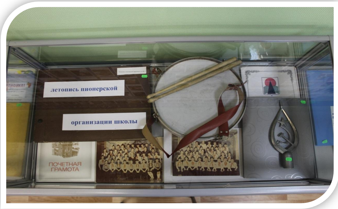
Экспозиция «Летопись пионерской организации средней школы №2». Тумба №3.