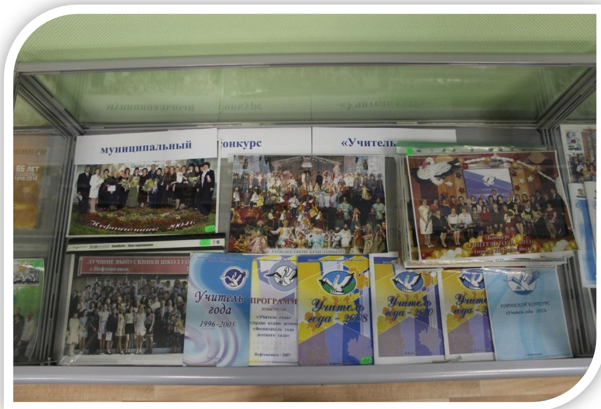
«Конкурсы». Экспонаты в витрине.