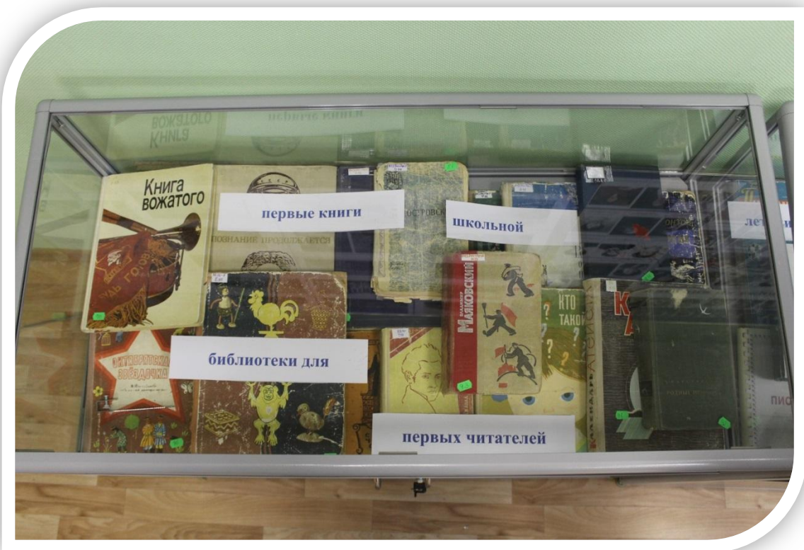
Экспозиция «Первые книги школьной библиотеки». Тумба №1.