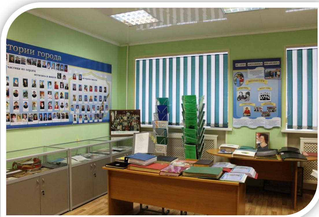
Панорама левой стены и центральной части музея.