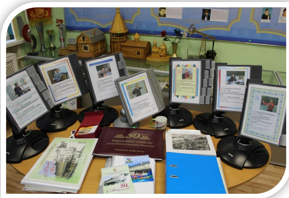
К 50-летию юбилею средней школы №2.