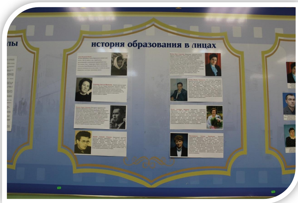
«История образования в лицах». Стенд 7, (№72).