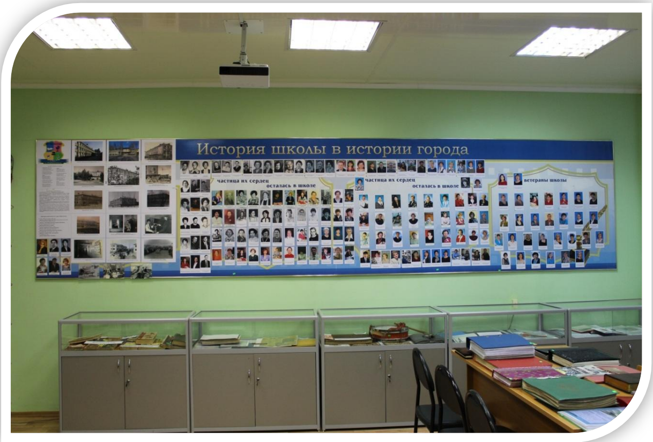
Панорама стендов №1,2,3,4 (№68-70). Тумбы с экспонатами.