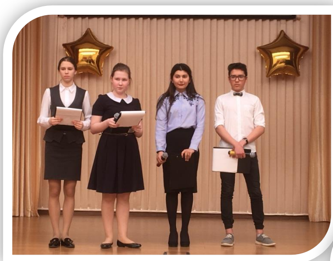
Муниципальный этап Всероссийской акции «Я – гражданин России».2018 год. Защита социально-ориентированного проекта «Родословная средней школы №2»