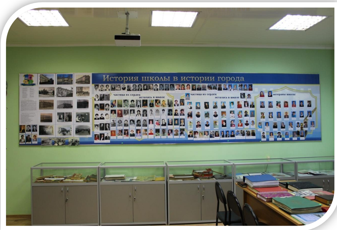
стендов №1,2,3,4 (№68-70). Тумбы с экспонатами.