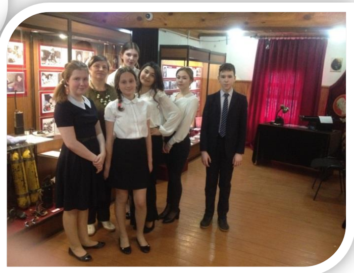
Участники Конкурса школьных экскурсоводов «История одного предмета» на приз руководителя НГ МАУК «Историко-художественный музейный комплекс». 2018 год.