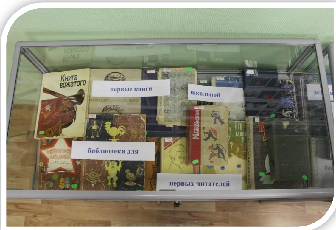
Экспозиция «Первые книги школьной библиотеки». Тумба №1.