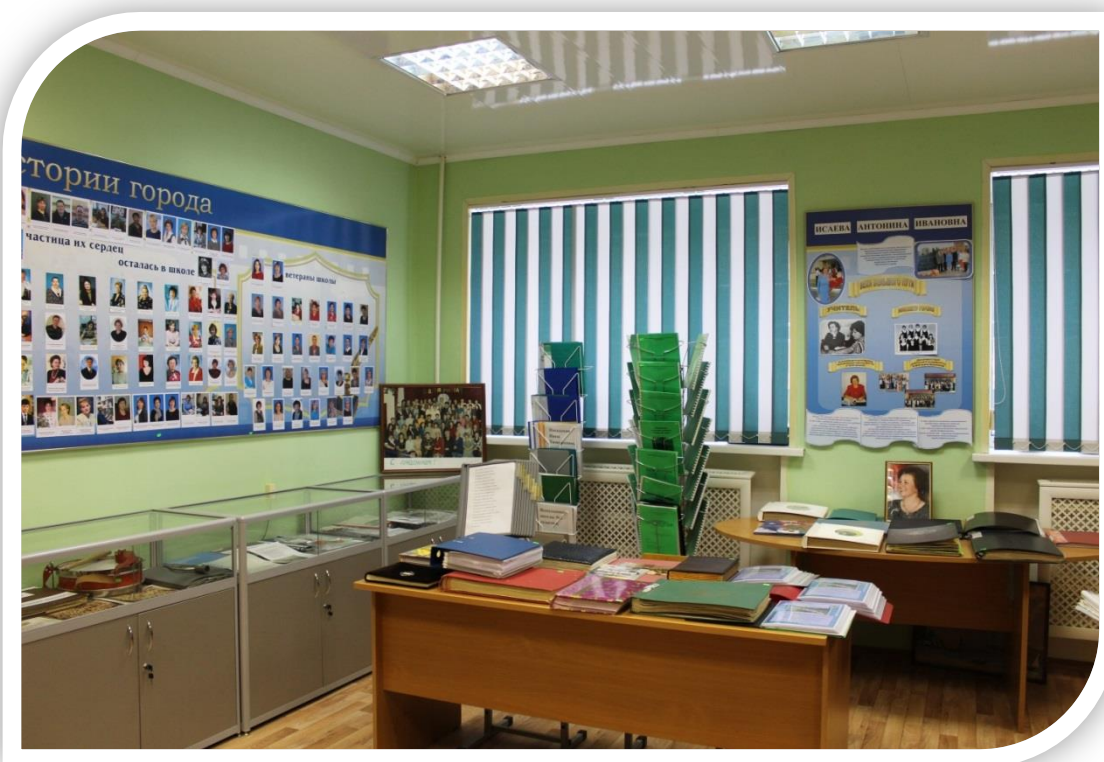
Панорама левой стены и центральной части музея.