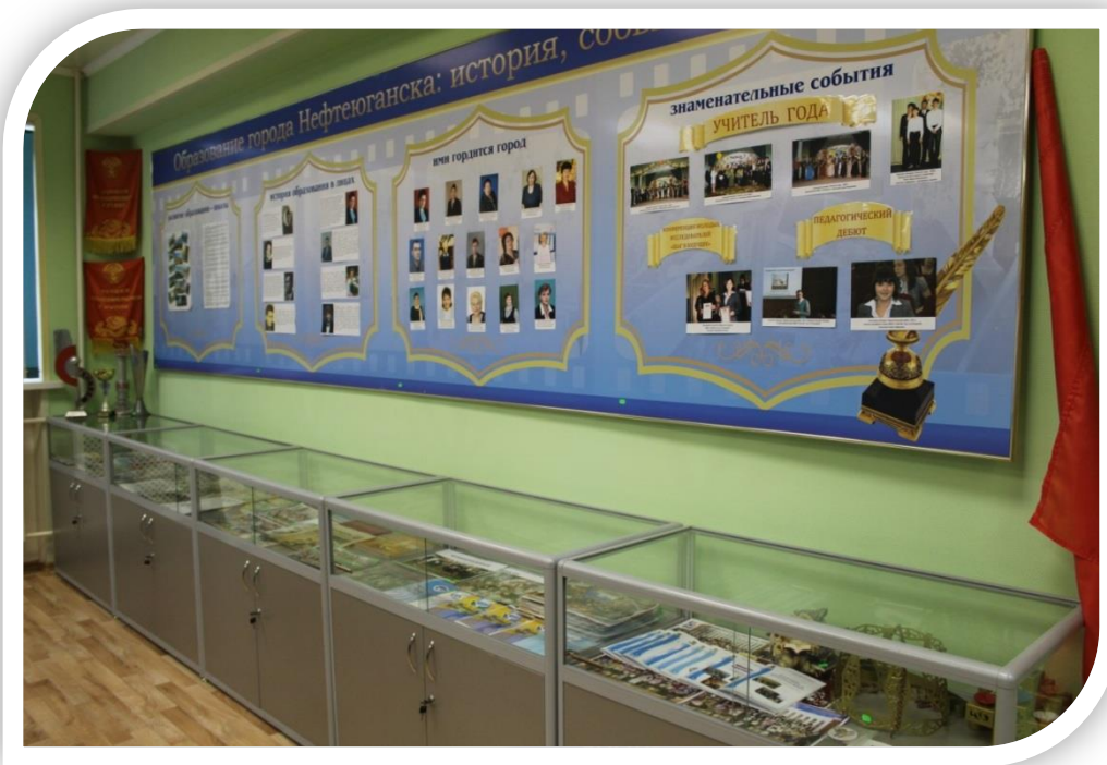
Панорама стендов, тумб №5,6,7,8.(Правая стена музея).