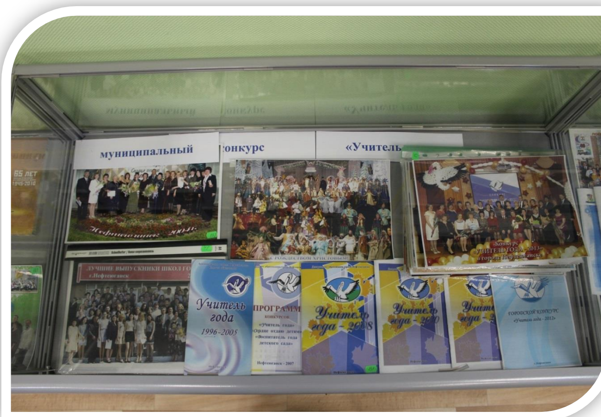
«Конкурсы». Экспонаты в витрине.